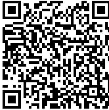
雀客 訂房 QR Code

※ 訂房連結： https://forms.gle/Cdt1dr62Q6Yv5bJq8